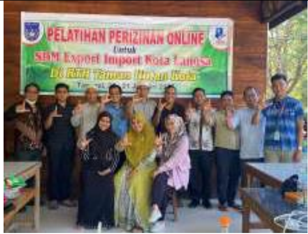
Dilaporkan oleh Sekretaris PT Pekola Perseroda