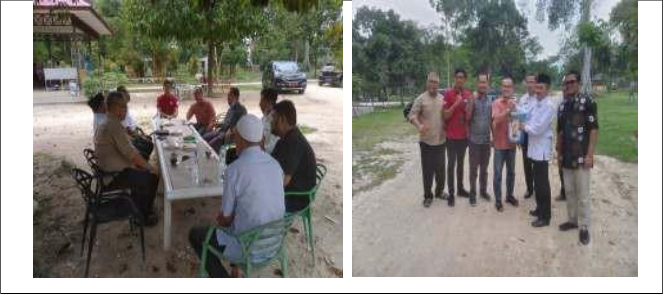
Dilaporkan oleh Sekretaris PT PEKOLA